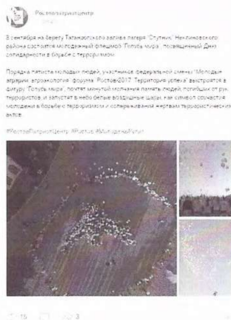
Рисунок 6 – Информация о предстоящем мероприятии в социальной сети «ВКонтакте»

Иллюстративным примером можно привести акцию памяти «Голубь мира», проведенную Ростовпатриотцентром в 2017 году. В сети Интернет была размещена анонсирующая информация (см. рисунок 6).